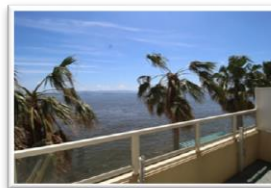
朝起きたら目の前が海♪贅沢なロケーションです！