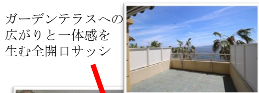
ガーデンテラスへの 広がり一体感を 生む全開口サッシ