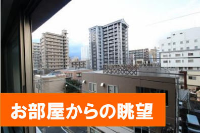
お部屋からの眺望